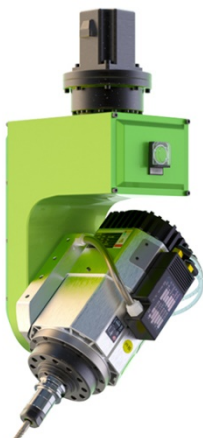
5.5-9KW, 风冷, 意大利进口, 气动换刀 (选配)