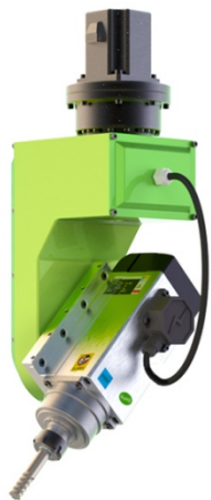
3.7-6.0KW, 风冷, 中外合资, 陶瓷轴承, 超高性价比 (选配)